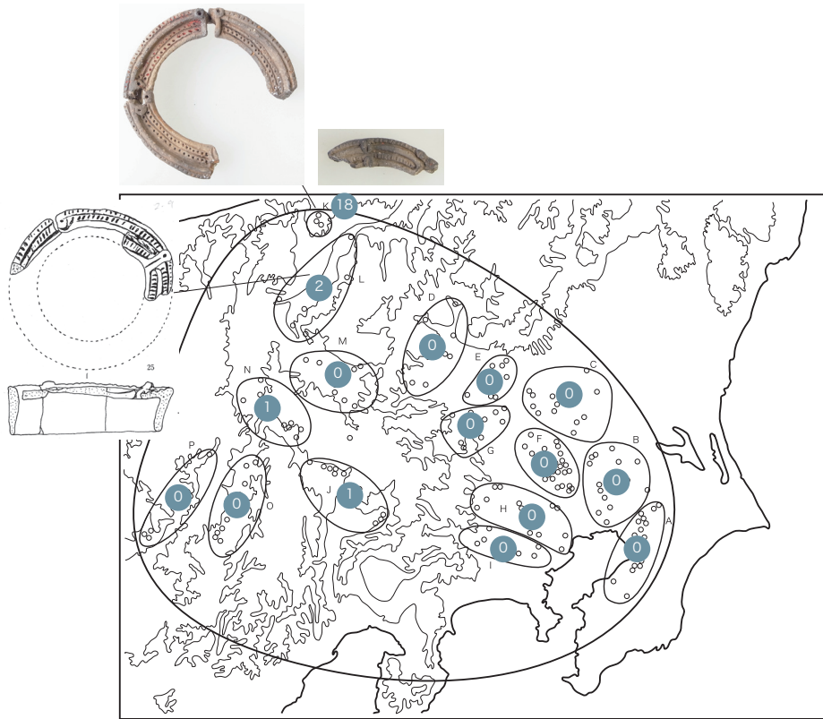
図2 分布パターン A (日本海地域のみにもみられるか、それ以外の地域には数点しかみられない) の一例