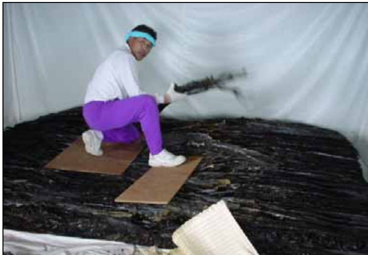
按醸（あんじょう）作業

昆布を海から採って、天日に干してから、重ねて寝かせて重しを乗せる。これを按醸（あんじょう）作業と言う。耳刈りというのは、昆布の端を成形する作業である。耳は、例の「昆布、昆布、昆布つゆ」という会社がどんどん買ってくれる。羅臼昆布の耳が一番高く、去年は大減産だったので、その耳の値段が利尻昆布の立派な一等検と相場が一緒だった。この羅臼昆布を少し入れて、ほかの昆布と混ぜて利用しているようだが、羅臼昆布はそのぐらい味が濃い。