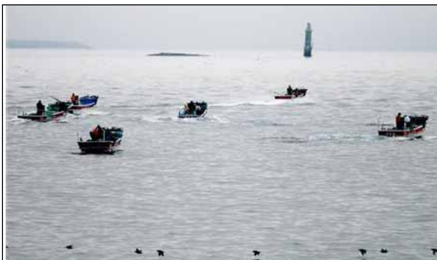
貝殻島の昆布漁(歯舞群島貝殻島に向かっている漁船)

この貝殻島の周辺は昆布が採れる所である。歯舞漁業協同組合や一部よその漁協組合が、民間交渉で昆布を採りに行く。6月に、決められたエリアにしか入れない。375艘の契約であるが、現在249艘になっている。高齢化が進み、昆布を採る人が少なくなっている。私は一生懸命昆布を売っているのだが、昆布が採れなくなったらどうなるのだろうと大変心配である。