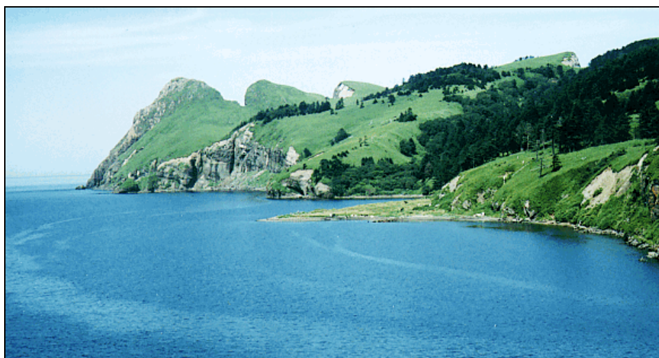
色丹島のマタコタン

この講座は、同じ内容で10月16日(金)19:00~21:00にスルガ銀行「d-labo」(ミッドタウン・タワー内)でも行われました。